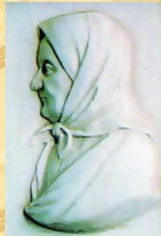
Яковлева Арина Родионовна