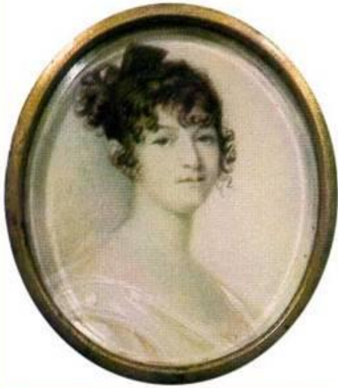
Н.О. Пушкина. 1800-е гг.

Мать, Надежда Осиповна , приходилась внучкой араму Петра I, впоследствии русскому генералу Ганнибалу.